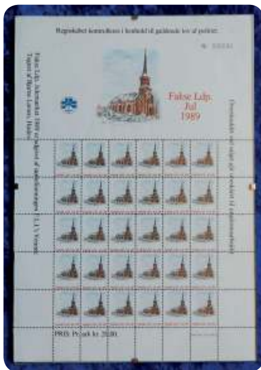
Støttejulemærke fra 1989

huse ud om sommeren og flyttede så selv ud i vaskehuset. Der blev bygget badhoteller, og der kom små sommerhuse på lejet grund. Da velstanden steg blev sommerhusene større på egen grund og større lejrpladser blev afløst af campingpladser. Vandrehjemmet i Faxe blev gradvist udbygget, og der kom lystbådehavn, kursuscentre og ferieboliger. Margueritrudden har vi kendt længe, og her først i det 21. århundrede har vi nu også fået en vandrerute Sydsjællandsleden, og vi ser også skilte med cykelruter og en Panoramarute gennem vort sogn.