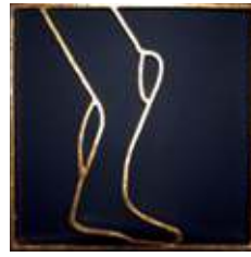
8) Jakob den Yngre Der bad så meget, at han fik hård hud på knæene.