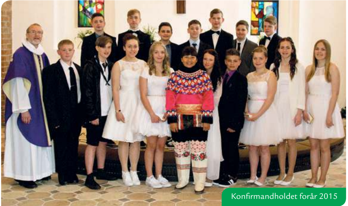
Konfirmandholdet forår 2015

Vi byder velkommen til efterårets konfirmander og håber de får en god tid henover efterår, jul og forår inden konfirmationen St. Bededag d. 22. april.