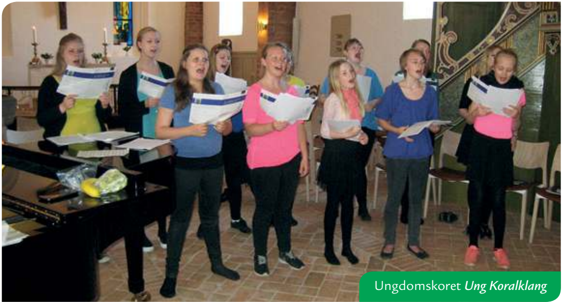
Ungdomskoret Ung Koralklang

Efteråret står for døren, og de mange fritidstilbud rundt omkring starter igen. Ved Faxe Kirke har vi ungdomskoret, Ung Koralklang , der er et gratis musikalsk tilbud til piger mellem 11 og 25 år. Vi øver hver torsdag aften fra 18.30 til 20.30 skiftevis i Sognehuset på Præstøvej og i kirken.