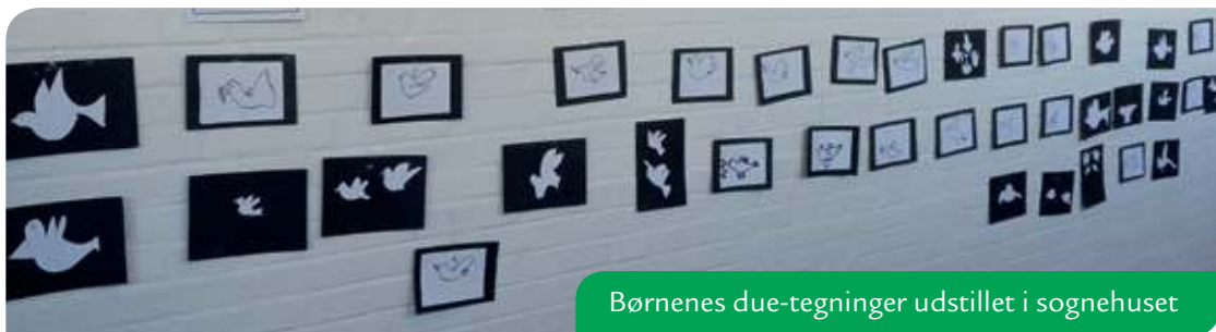
Børnenes due-tegninger udstillet i sognehuset