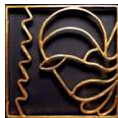
12) Simon Zelotes Der blev savet i 2 – samme scene ses også afbilledet på kalkmalerierne i kirkens våbenhus.