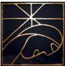
6) Thaddæus Med Betlehems-stjernen. Thaddæus var iflg. traditionen en af hyrderne på marken, da Jesus blev født.