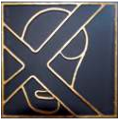
3) Andreas Med sit X-kors – også kendt fra Skotlands flag.