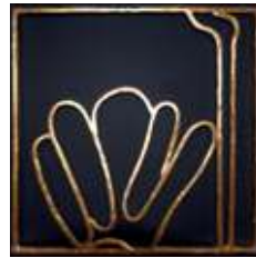
9) Jakob den Ældre Med ibs-skallen og pilgrimstav.