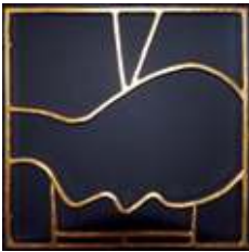
4) Matthæus Der blev halshugget og derfor ses med hovedet på blokken og sværdet i nakken.