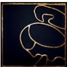
7) Johannes Forbindes ofte med evangelisten Johannes og har derfor evangelistens symbol: Ørnen ”i nakken”. Ordet udgår af hans mund, nærmest som råbt