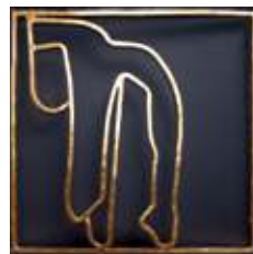
11) Bartholomæus Der fik huden flået af sig.